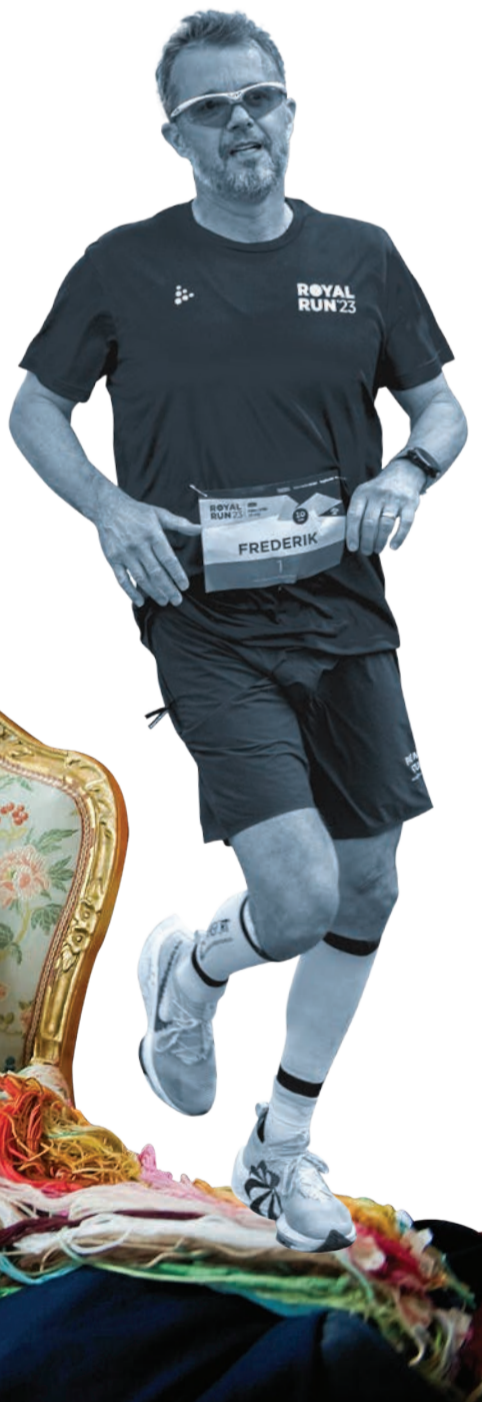
COLLAGE: HENRIETTE VABØ